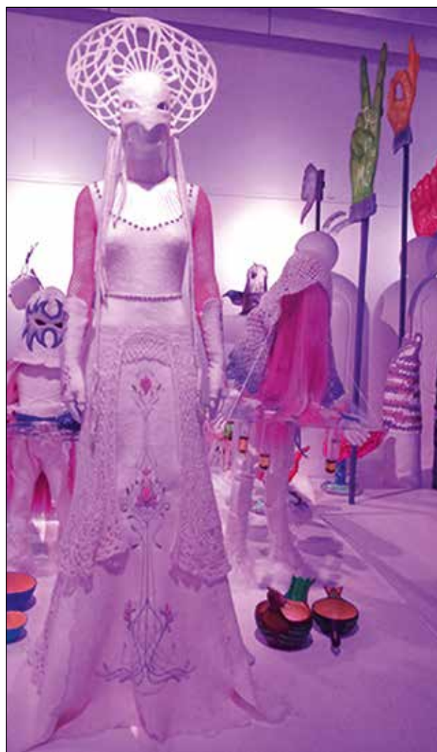
Next Level Craft, hemslöjdsutställning.