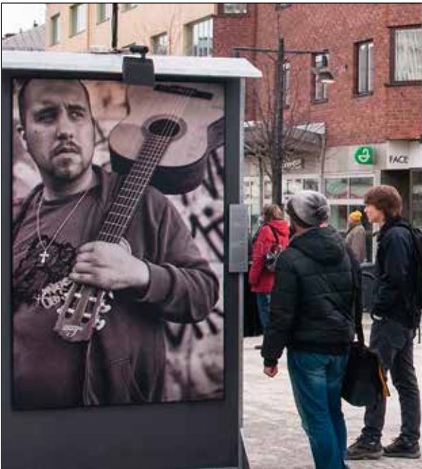
Utställningen Romska röster.