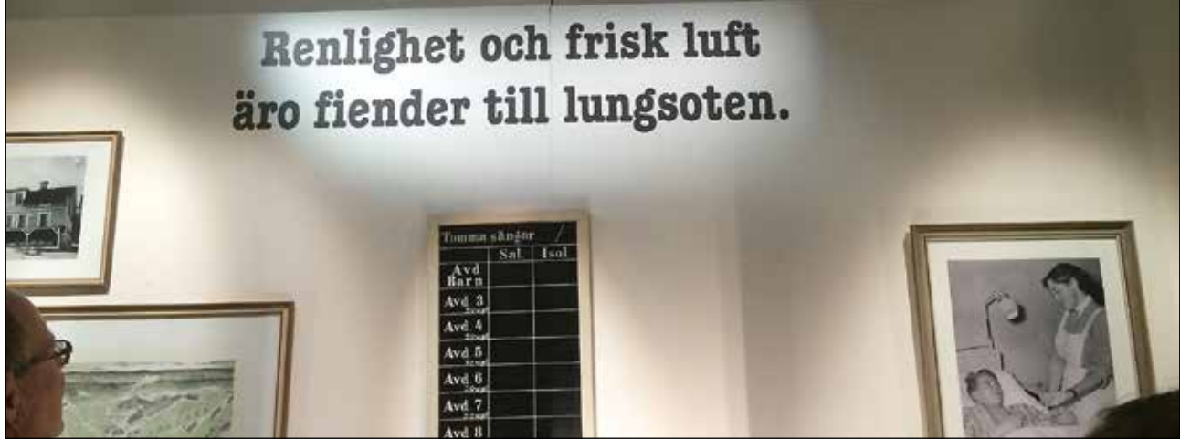
Utställningen Hosta på Norrbottens museum.