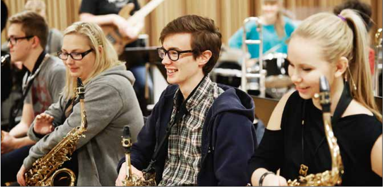
Musiker ur AYJO, Norrbottensmusikens ungdomsstorband.

av alla tre verksamheterna under paraplyet Konstmuseet i norr. Beslut har fattats under 2014 om att ett länskonstmuseum ska ingå i det nya Stadshuset i Kiruna, att Havremagasinet verksamhet ska permanentas och att Resurscentrum för konst avses att permanentas från år 2015. Projektet Konsthall Tornedalen går mot sitt förverkligande tack vare stöd från olika håll, framför allt Länsstyrelsen, Landstinget och Övertorneå kommun.