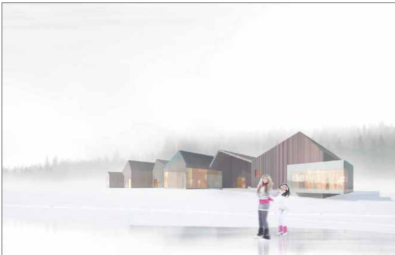
Konsthall Tornedalen, arkitekturritning.

Avsikten är också att genomföra kommunbesök från Norrbotten i kommuner på Västkusten som arbetat med metoden Cultural planning. Tjörn och Akvarellmuseet ses som central kommun i besöket kombinerat också för Konsthall Tornedalens kommande verksamhet.